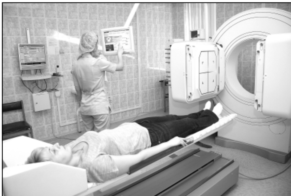
В прошлом году высокотехнологичную медпомощь получили 1986 жителей региона - это на 52 процента больше, чем в 2009-м.

АКТУАЛЬНЫЕ ПРОБЛЕМЫ РЕГИОНАЛЬНОЙ СИСТЕМЫ ЗДРАВООХРАНЕНИЯ И ПЕРСПЕКТИВЫ ЕЕ РАЗВИТИЯ ОБСУЖДАЛИСЬ НА СОВМЕСТНОМ ЗАСЕДАНИИ КОЛЛЕГИИ МИНИСТЕРСТВА ЗДРАВООХРАНЕНИЯ ОМСКОЙ ОБЛАСТИ И III ПЛЕНУМА ОТРАСЛЕВОЙ ОБПРОФОРГАНИЗАЦИИ. В ЦЕНТРЕ ВНИМАНИЯ УЧАСТНИКОВ ВСТРЕЧИ БЫЛИ ТАКЖЕ ИТОГИ ВЗАИМОДЕЙСТВИЯ СТОРОН СОЦПАРТНЕРСТВА В РЕШЕНИИ СОЦИАЛЬНО-ЭКОНОМИЧЕСКИХ ВОПРОСОВ.